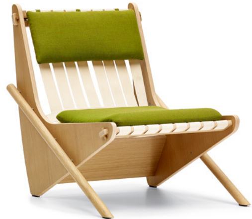
Mit seine schwungvollen Seitenteilen und der Gurtspannung ist der „Boomerang Chair“ aus den 1940er Jahren längst zur Ikone geworden.