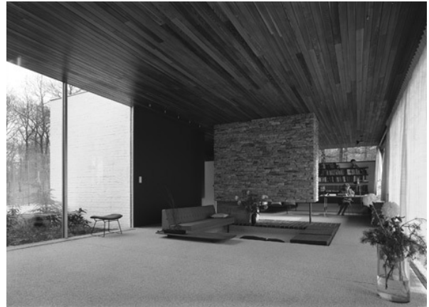
Neutra ist bekannt für seine großen, lichtdurchfluteten Räume.