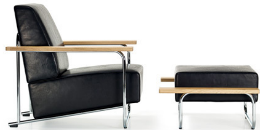
Mit dem Hersteller VS geht der Lovell Easy Chair nun in Serie.