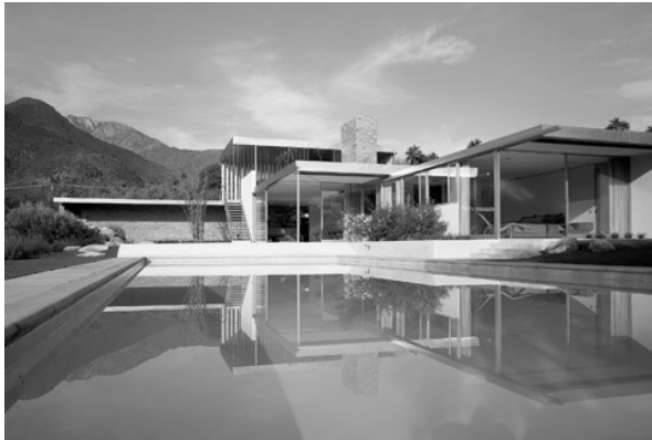
Der Architekt verkörpert bis heute den „International Style“, weil seine Bauten die Moderne Europas mit jener der USA verbindet.