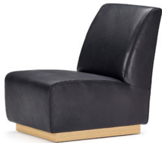
Der „Slipper Chair“, ein zeitloser Stuhl mit klaren Formen und kompakten Maßen.