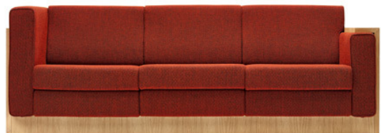
Das „Alpha Seating Sofa“ wurde ursprünglich für das Lovell Health House 1929 entworfen.