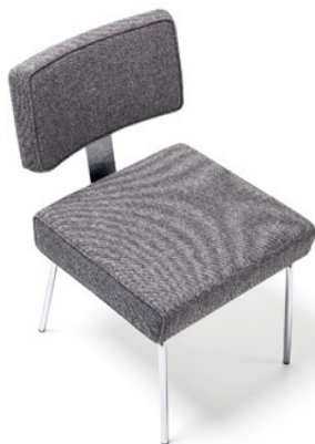
Dynamisch und elegant – der „Tremaine Side Chair Steel“ als Sinnbild der „Martini-Moderne“.