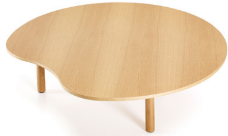
Der „Low Organic Table“ ist ein Abstelltisch mit einer Freiformfläche und weichen Linien.