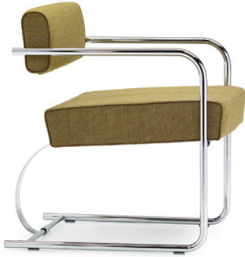
Der „Cantilever Chair“ weicht in seiner Gestaltung von den klassischen Freischwingern der 1930er Jahre ab. Die Sitzfläche ist hier von der Rückenlehne getrennt.