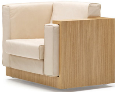
Die „Alpha Seating“ Möbel wurden als Einbaumöbel konzipiert, funktionieren aber freistehend auch sehr gut.