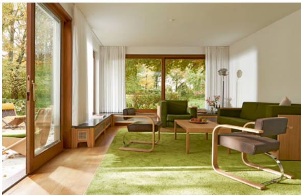
Die Kollektion Neutra eignet sich für private Wohnräume genauso gut wie für Büros, Lounges, Lobbys und Hotels.