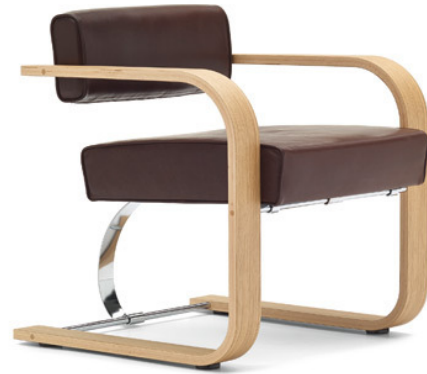
Eine andere Version des „Cantilever Chairs“: Schichtholz mit Eichenfurnier, kombiniert mit natürlichem Nappaleder.