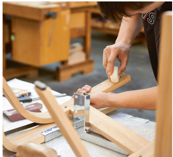
VS Vereinigte Spezialmöbelfabriken produziert hochwertige Objektmöbel für Schulen und Büros.